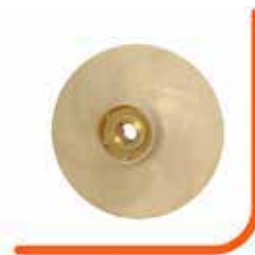
Rotor centrífugo fechado em noryl