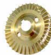
Rotor periférico em bronze