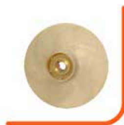
Rotor centrífugo fechado em noryl